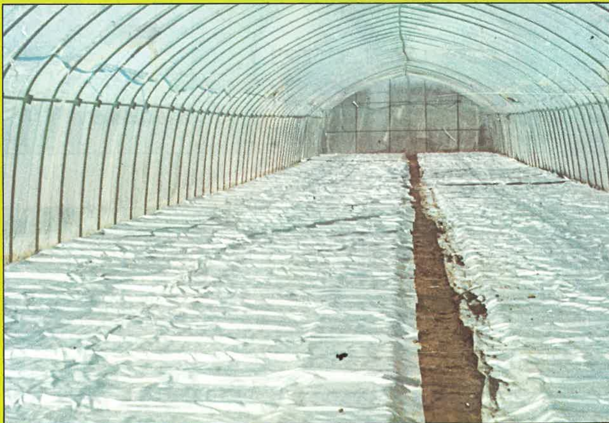
育苗箱にシルバーポリトウを直掛したハウス内の状態