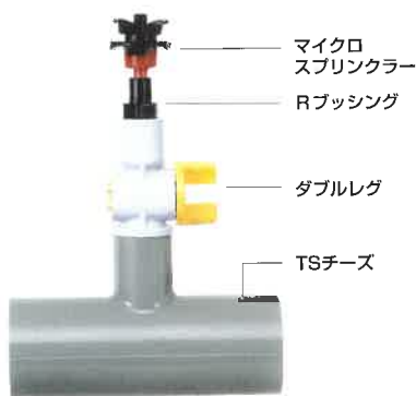
マイクロスプリンクラーセット

●流量調整機能付で、調整コックにより水量調節し、長距離均一にかん水します。しかも、かん水不要部分は止水できます。