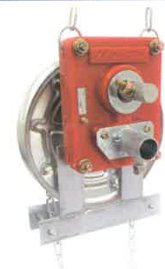
ニューキャレージ NAS-160(チェーン4.4m付) NAS-260(チェーン6.6m付)