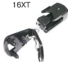
マルチハンガークリップ (妻部スライド用) 16XT