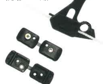
先端ロープ用 カーテンクリップ CZ-10