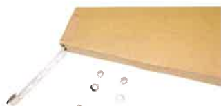
応用ベルト ボルトナット付 24S