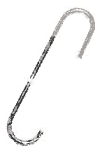
ロングフック25*25 LM-150/350/650/1100 (M型用)