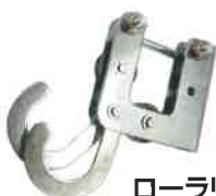
ローラリング M-2(補修用)