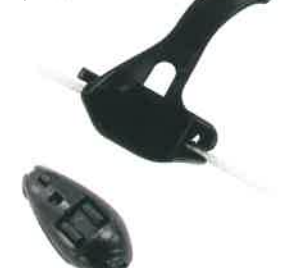
フィルムクリップ 16D (固定張用)