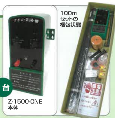
100m セットの 梱包状態

○電源は、ソーラー電源(別売)・単一形アルカリ乾電池8個(別売)・ACアダプター(別売)にて100V電源・外部バッテリーコード(別売)にて12Vバッテリー(自動車用等)で使用可能。○防雨型ですので、屋外での使用可能です。○昼夜(連続)モードと夜間モードの切り替えが可能です。