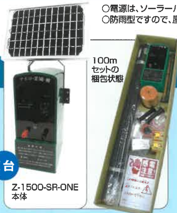
100m セットの 梱包状態

○電源は、ソーラーパネルと専用充電式バッテリーで手間いらずで便利です。○防雨型ですので、屋外での使用可能です。○昼夜(連続)モードと夜間モードの切り替えが可能です。